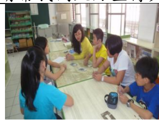
義大學生英語互動教學