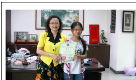
閱讀小博士與校長合影