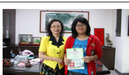
閱讀小博士與校長合影