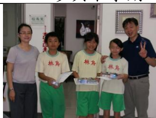
名家英語單字進階通過