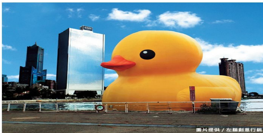
圖片提供 / 左腦創意行銷

黃 色小鴨，是許多人小小時候的玩具，小小的黃色小鴨，浮在水面上搖搖擺擺的，總是讓小孩子覺得驚奇又開心；現在，宇宙超級無敵霹靂放大版的黃色小鴨來了！而且這一次不是停在小孩子的澡盆裡，這一次是停放在愛河的河畔！