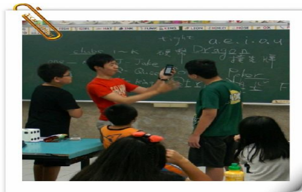
圖：課後英語社團教學花絮